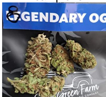
Foto del campione